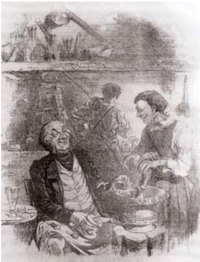
Charles Jacques, Charivari, 1840.