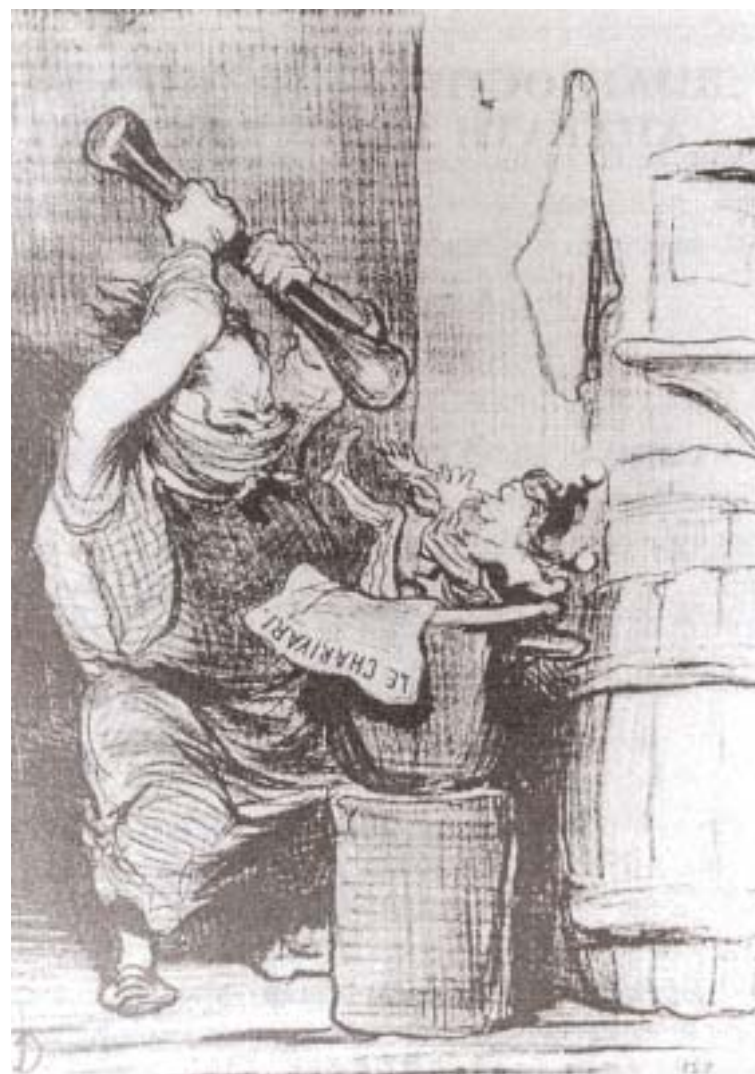
Honore Daumier, Charivari, 1850.

Овај хемијски продукт је справљан од стране аутора у Квебеку. Аутор је веровао да овај препарат преко лимфе усмерава азот у ћелијама рака на спречавање стварања токсичних секрета, који блокирају одбрамбени систем организма. Канадско Министарство здравља је објавило да овај препарат поред алкохола садржи камфор, хлор, нитрат амонијак и воду. У извештају се такође наводи да овај препарат нема никаквог утицаја на рак и СИДУ, а може довести до нежељених ефеката. Године 1956. због новог препарата, GN-24 , аутор је осуђен на губитак права за лечење уз велику новчану казну. Поново је осуђиван 1964. године на Корзици због примене новог анти-канцерског лека.